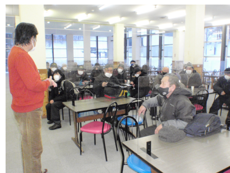
スキー場、スキー場